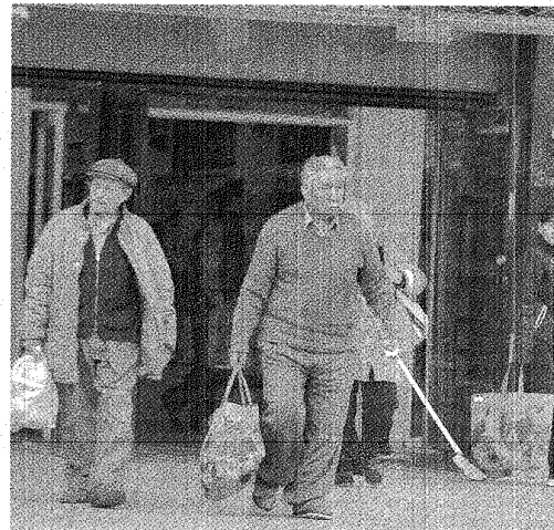
CAMBIO DE COSTUMBRE. LA GENTE YA NO UTILIZA MÁS LAS DE POLIETILENO.

El mes pasado y a instancias del Ministerio de Ambiente del Chubut los municipios de Rawson, Trelew, Puer-