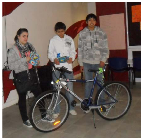
Los felices ganadores del concurso disfrutaron de los premios recibidos.

encuentro de Sinopec Argentina con la comunidad, y están abiertos para todos aquellos que quieren participar de actividades divertidas y novedosas relacionadas con la informática, el arte, la tecnología y la vida comunitaria.