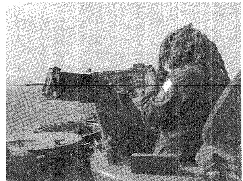
EN CERRO BAGUAL SE EFECTUARON EJERCICIOS CON MORTEROS Y CAÑONES.