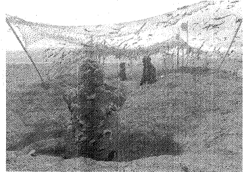
SE INCLUYÓ TAREAS DE ALISTAMIENTO, OCUPACIÓN DE POSICIONES Y DEFENSA.

Por otra parte, en Puerto Deseado, la Unidad de caballería desarrolló actividades de instrucción, logísticas y de seguridad. También efectuó ejercicios de repliegue a una nueva zona de reserva continuado por una actividad de reorganización y desarrollo de una nueva actividad. Por último, realizaron abandono de zona de reserva, ejecución de avance para tomar contacto nocturno, seguido de ataque, y tiro con Tanques SK 105. Cabe destacar que todas las operaciones concluyeron positivamente, y que las actividades desarrolladas por las unidades militares son de simulación, es decir, se realizan en zonas habilitadas para dichos fines.#