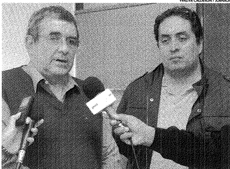
WALTER CALDERÓN / JORNADA

cia y agregó que “se está trabajando con el Ministerio de Ambiente de Provincia para armar este proyecto en Comodoro. Ya hemos mantenido reuniones y queremos avanzar porque la idea es entregar estos ladrillos a personas de escasos recursos para la calefacción de sus domicilios”, detalló. Para quienes estén interesados en participar, pueden consultar o inscribirse a dexedamb@gmail.com o llamar al teléfono 447-0044 del Departamento de Extensión y Educación Ambiental del municipio de Comodoro Rivadavia. #