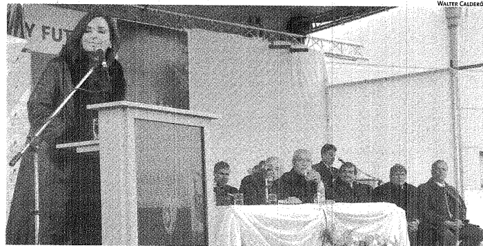
CRISTINA FERNÁNDEZ DE KIRCHNER HABLÓ DE LA NECESIDAD DE “SEGUIR SOSTENIENDO UN MODELO”.

Cristina Kirchner dijo a los que ya han logrado incorporarse al proceso productivo que “tenemos que seguir trabajando por aquellos argentinos que todavía no han conseguido trabajo o están en la informalidad”. Pidió