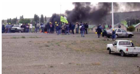
A pesar de las promesas, la UOCRA sigue intervenida. (Foto archivo).