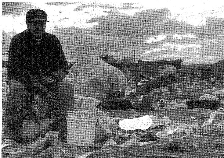
■ Uno de los primeros aspectos a establecer es la cantidad de gente que basa su economía de lo que puede juntar en el basural.

En este marco, Quiroga recordó que la legislación nacional expresa que la potestad sobre los residuos que se van a procesar es el generador; de ahí que su propuesta no solo contempla la generación de más empleo en torno a la clasificación y venta, sino además el retorno a los