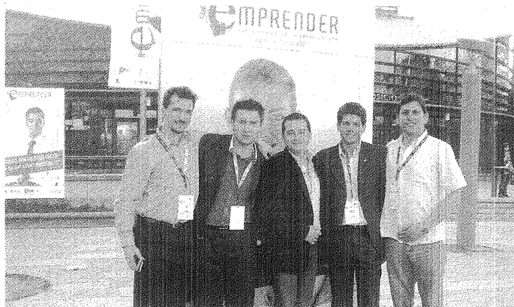
LA DELEGACIÓN COMODORENSE EN MENDOZA. LOS JÓVENES EMPRESARIOS ASISTIERON AL EVENTO "EMPRENDER 2.011".