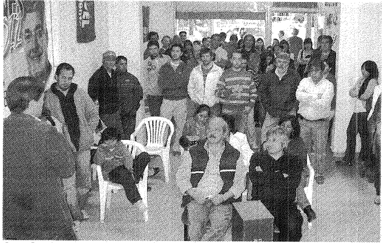
CHARLA. EL OBJETIVO DEL DASNEVISMO ES BUSCAR MÁS VOTOS PARA EL 23 DE OCTUBRE.

Advertió el dirigente que los tres primeros integrantes de la lista del Frente para la Victoria no son de la cordillera, y "entendemos que es un dato adicional por lo que significa la región", agregando que para los próximos días la idea es estar en vínculo con la militancia, y comenzar con el reparto de la boletas, mientras programan un encuentro para el próxi-