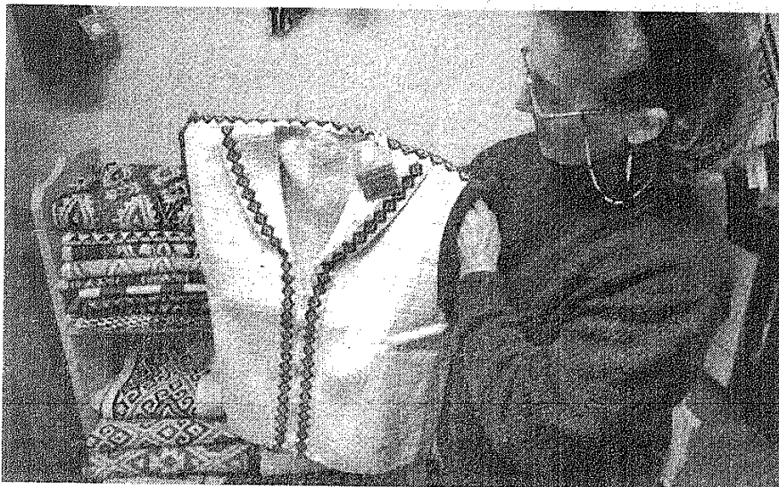
■ Las prendas de vestir son uno de los clásicos elegidos para festejar a las madres en su día.