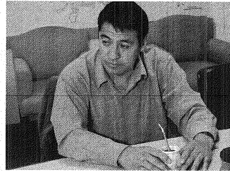
Valerio Gómez / El Patagónico

Sobre el panorama político el jefe comunal señaló: "el objetivo