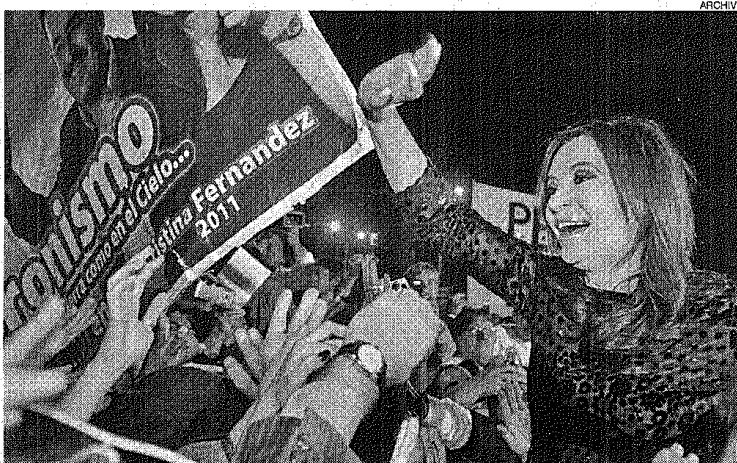
■ La Presidenta cerrará su campaña el próximo miércoles en el Teatro Coliseo.

radicar la principal pelea de estos comicios, más allá de que esté en juego el sillón presidencial.