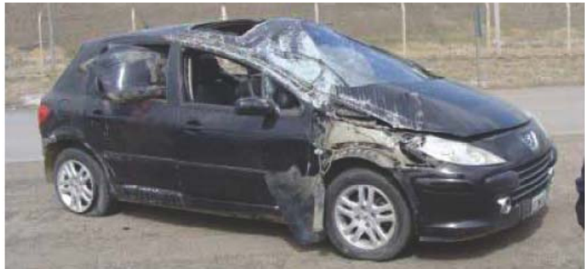
Así quedó el 307 tras el vuelco.

REDACCION TiempoSur redaccion@tiemposur.com.ar