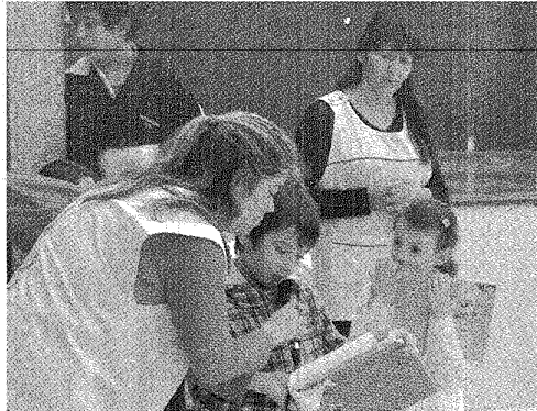
UNOS 1.500 CHICOS SE ABOCARON AL TRABAJO DE DESAFÍO LEER.

El Changuito de Lectura (Rincón de Lectura móvil) provisto con 50 libros nuevos y 50 juegos didácticos, recorrió seis instituciones de nuestra localidad, por segundo año consecutivo. Para ello, voluntarios de La Anónima