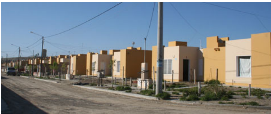
HAY ESPERAS DE HASTA VEINTE AÑOS