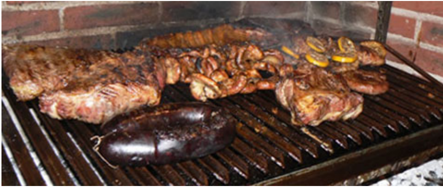
FESTEJO ANTES DE LAS PRIMARIAS