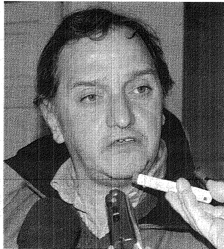
■ El próximo viceintendente reiteró que la nueva estructura prescindirá de varias secretarías que hoy funcionan.

Sus declaraciones se dieron al término de una nueva reunión de trabajo celebrada con los ediles del Frente para la Victoria, en las que habitualmente se analizan las iniciativas con las que se puede avanzar antes del 10 de diciembre, fecha de asunción de las autoridades electas.