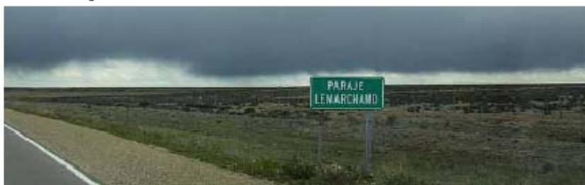
El objeto es cubrir las necesidades del paraje. (L. F)

Asimismo, el Paraje Lemarchand donará dos predios para que en un futuro se levante un Destacamento Policial y un Puesto Sanitario, ya que este sitio de la provincia es un punto estratégico por donde circulan muchos vehículos. ■