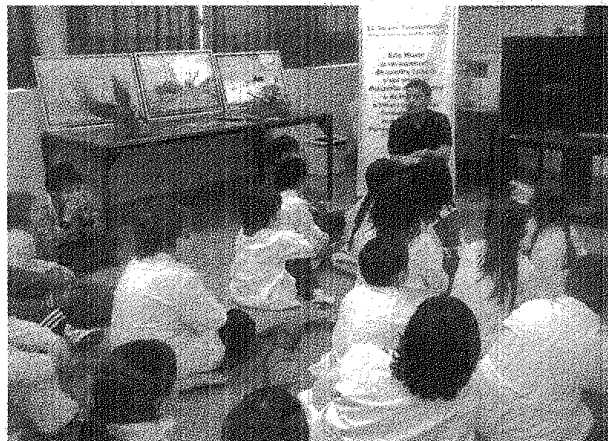
EL PROYECTO "EL MUSEO FERROPORTUARIO VISITA TU ESCUELA, TU BARRIO, TU LUGAR...".