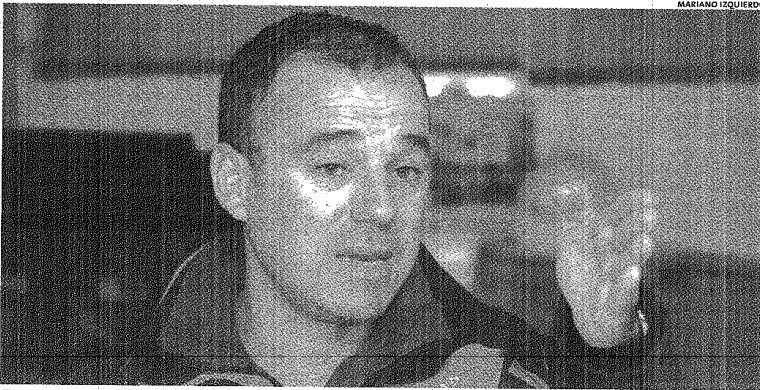
EN ENTREVISTA. EL HOMBRE NO ESQUIVÓ NINGÚN TEMA Y DICE QUE DE A POCO SE ENAMORA DE ESTA PATAGONIA.

cada aterrizaje en Ezeiza. "Se vislumbran mejoras y que el país no se queda atrás, escucha lo que pasa en el mundo". Por eso cree que el parque de Rawson debe ser un orgullo. Y que las próximas etapas son "la capacitación y las ganas de mantener el estándar de calidad y no que por aquí nadie me ve, lo hago mal. Hay que demostrarle al mundo que aquí se hacen bien las cosas".