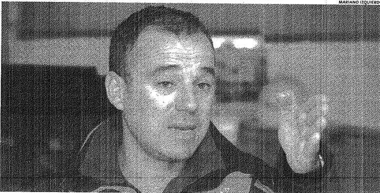
EN ENTREVISTA. EL HOMBRE NO ESQUIVÓ NINGÚN TEMA Y DICE QUE DE A POCO SE ENAMORA DE ESTA PATAGONIA.

cada aterrizaje en Ezeiza. "Se vislumbran mejoras y que el país no se queda atrás, escucha lo que pasa en el mundo". Por eso cree que el parque de Rawson debe ser un orgullo. Y que las próximas etapas son "la capacitación y las ganas de mantener el estándar de calidad y no que por aquí nadie me ve, lo hago mal. Hay que demostrarle al mundo que aquí se hacen bien las cosas".