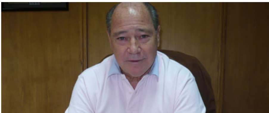
EL BANCO DEL CHUBUT EN LA MIRA