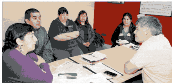
Acosta recibió a los padres preocupados por la situación que genera la falta de agua.

Córdoba detalló que "vinimos a apoyar a la escuela y a la directora, porque ella debe hacer trámites administrativos, al igual que la su-