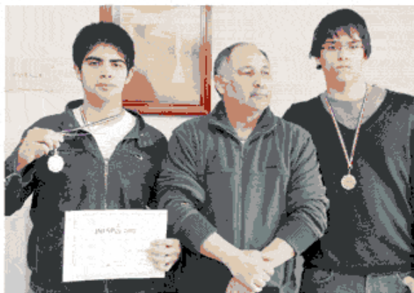
Los alumnos junto al profesor. Ahora los espera exponer en Holanda.