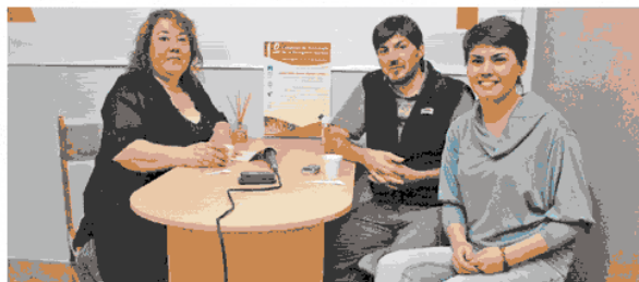
El anuncio fue realizado en la oficina de la Asociación de Psicólogos de Caleta Olivia.

Por lo que este congreso nos va a permitir poder intercambiar pensamientos que tienen que ver con la región y con la zona", sostuvo el profesional.