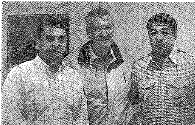
■ Intendentes de la meseta chubutense con el gobernador de San Juan. José Gioja les habló positivamente de la explotación minera.