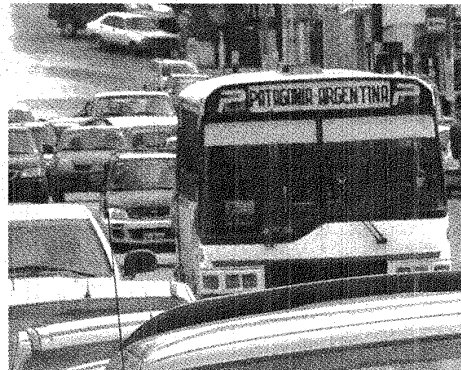
LA QUE MÁS. DESDE COMODORO, PATAGONIA FUE LA FIRMA MÁS BENEFICIADA.

El caso de la empresa Patagonia Argentina de Comodoro es llamativo: con más de 2 millones mensuales de promedio es una de las dos empresas que mayor subsidio percibe en la región patagónica. La que mayor subsidio percibe en la Patagonia es Indalo