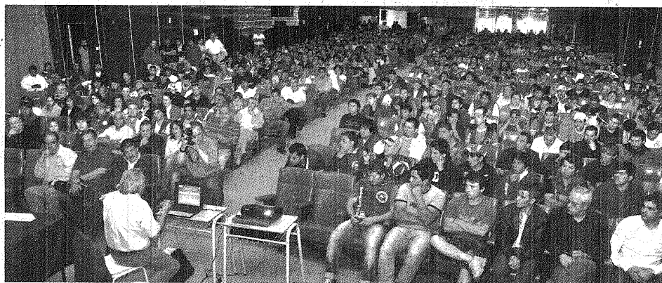
■ Hubo tres disertaciones en el Aula Magna de la UNPSJB.

Los diputados provinciales electos por la Corriente Sindical Peronista impulsaron un debate sobre la minería, el viernes en el Aula Magna de la Universidad Nacional de la Patagonia San Juan Bosco (UNP-