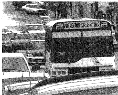
LA QUE MÁS. DESDE COMODORO, PATAGONIA FUE LA FIRMA MÁS BENEFICIADA.

El caso de la empresa Patagonia Argentina de Comodoro es llamativo: con más de 2 millones mensuales de promedio es una de las dos empresas que mayor subsidio percibe en la región patagónica. La que mayor subsidio percibe en la Patagonia es Indalo