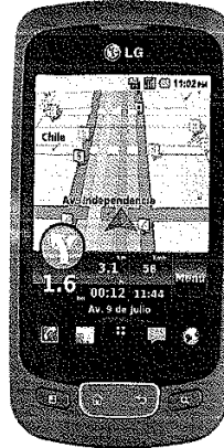
LG Optimus One