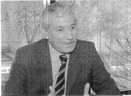
BELIZ AGRADECIÓ EL ACOMPAÑAMIENTO DE LOS AFILIADOS.

Las autoridades informaron que hoy el gremio de los mercantiles esta instalado como uno de los mejores del país, "se valora lo que hacemos, y demostramos el 26 de septiembre como representamos a nuestros afiliados y como marcamos el destino del gremio más grande de la actividad privada", aseveró.#