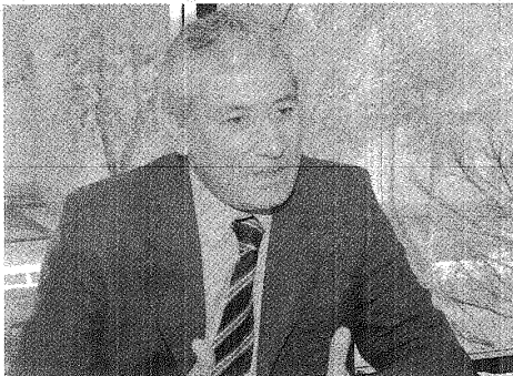
BELIZ AGRADECIÓ EL ACOMPAÑAMIENTO DE LOS AFILIADOS.

Las autoridades informaron que hoy el gremio de los mercantiles esta instalado como uno de los mejores del país, "se valora lo que hacemos, y demostramos el 26 de septiembre como representamos a nuestros afiliados y como marcamos el destino del gremio más grande de la actividad privada", aseveró.#