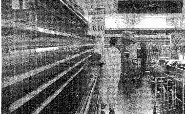
GÓNDOLAS VACÍAS. LOS SUPERMERCADOS DEBIERON RETIRAR TODA LA MERCADERÍA POR LA PÉRDIDA DE LA CADENA DE FRÍO.