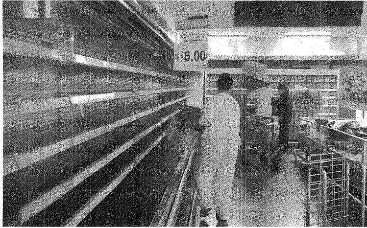
GÓNDOLAS VACÍAS. LOS SUPERMERCADOS DEBIERON RETIRAR TODA LA MERCADERÍA POR LA PÉRDIDA DE LA CADENA DE FRÍO.