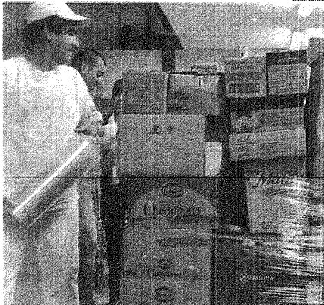
A TIRAR TODO. LOS COMERCIOS PERDIERON MUCHA MERCADERÍA POR EL APAGÓN.