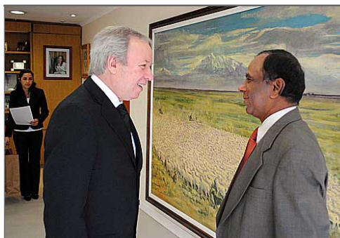
Gobernador recibió al Embajador de la India.