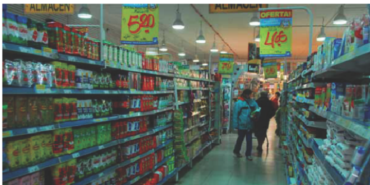
Indicaron que la inflación general afectó el precio de góndolas. (H. C)

mercados remarcaron que la suba de precios se debe a un valor inflacionario conocido y que termina afectando en las góndolas. Señalan que entre las inflaciones que más tuvieron influencia está la nafta, ya que debido a esto también se hace más caro el transporte hacia el sur. "no es una cuestión inherente a los supermercados, son cosas de más arriba. El fabricante sube el costo de los productos y se debe trasladar eso a las góndolas. Es algo simple, pero difícil de explicar" resaltó uno de los empresarios de supermercado a este medio.