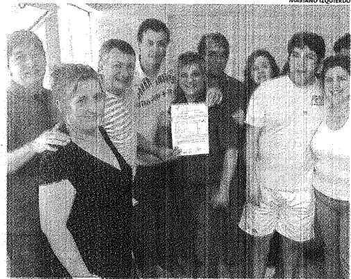
MIEMBROS DE LA T7 DE OCTUBRE Y ADHERENTES A LA CELESTE Y BLANCA.